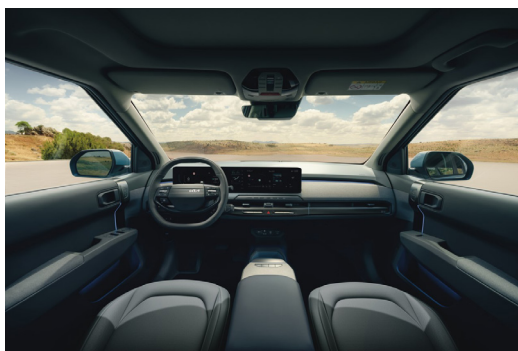
EV3 Plus Konstläder