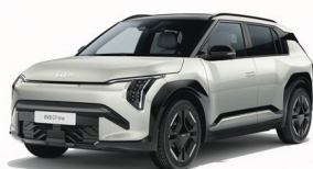
Ivory Silver [ISG] metallic