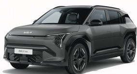
Shale Gray [EBD] metallic