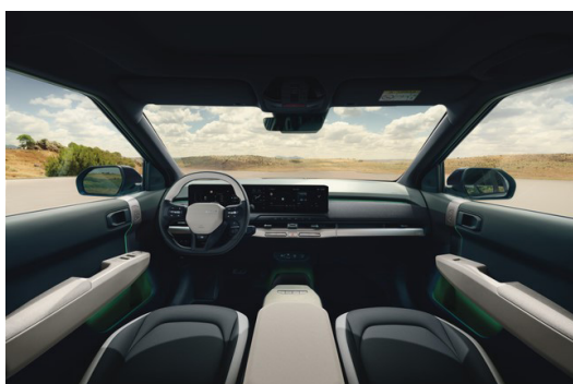
GT LINE Konstläder Vit/Svart