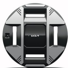
EV3 Plus 19" aluminiumfälgar med aerodynamisk hjulsida 215/50 R 19