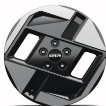
EV3 17" aluminiumfälgar med aerodynamisk hjulsida 215/60 R17