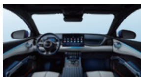
Blå och grå