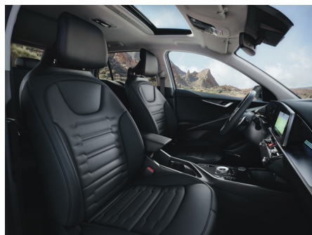
Konstläder i svart (Advance SE)