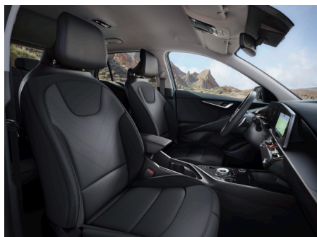
Svart tyg (Action SE)