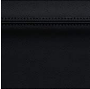
IN- TERIÖRDEK OR